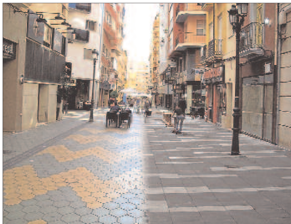
Fotomontaje que muestra el antes y el después de la calle Castaños frente al Teatro Principal. A la derecha, fotomontaje del aspecto anterior y del actual de la calle Castaños.