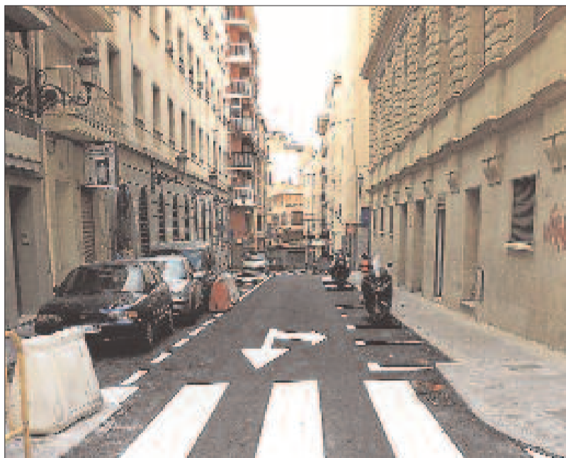
Operarios en plenas obras de la calle Castaños. A la derecha, una vista de la calle Jerusalén recién pintada.

bajado en la calle Castaños, Álvarez Soto y San Ildefonso, instalando nuevas redes de agua potable, alcorques, riego y alumbrado. Además se han instalado las redes de media tensión y gas a cargo de las empresas suministradoras.