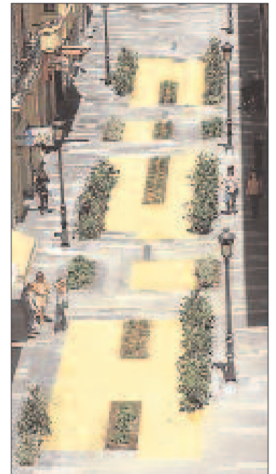
A la izquierda, calle Castaños frente al Teatro Principal. En el centro, aspecto de la calle Teniente Álvarez Soto. A la derecha, vista aérea de la calle Castaños.