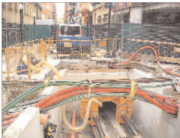
Grúas, vallas y tuberías operan por las calles del centro de Alicante durante el transcurso de las obras.