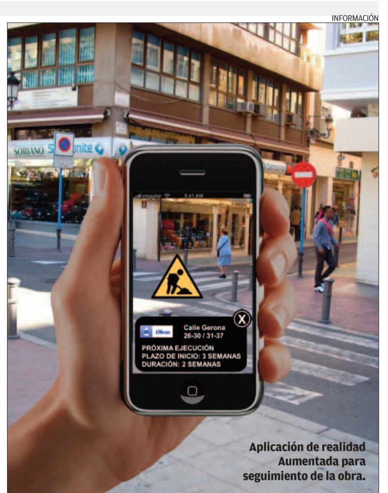
Aplicación de realidad Aumentada para seguimiento de la obra.

una campaña de información «puerta a puerta». Antes de que se inicien las obras en cada tramo se informará a todos los representantes de los vecinos y empresarios de los plazos, rutas de desvío para el tráfico rodado, gestión de vados y plazas de estacionamiento para minusválidos, nueva situación de las terrazas o de las zonas de carga y descarga.